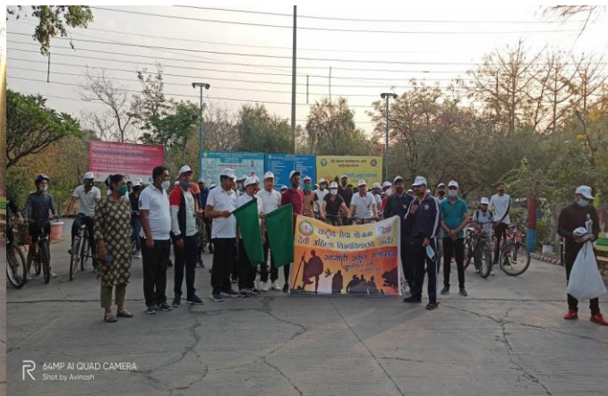
64MP AI QUAD CAMERA