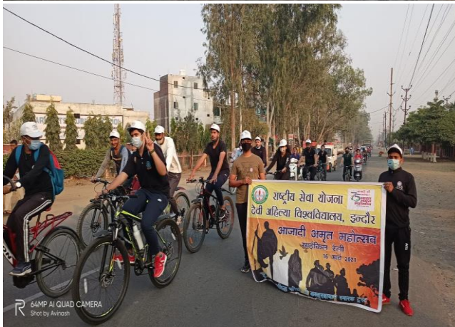
64MP AI QUAD CAMERA