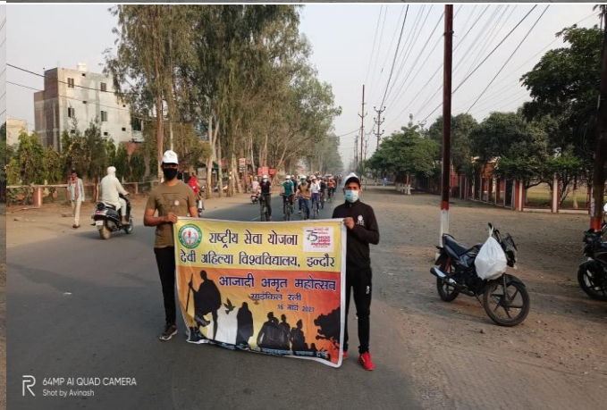
64MP AI QUAD CAMERA