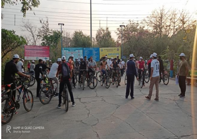
64MP AI QUAD CAMERA