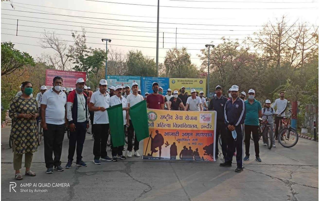
64MP AI QUAD CAMERA