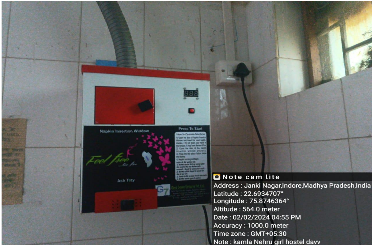
SANITARY NAPKIN DISPENSER AND INCINERATOR